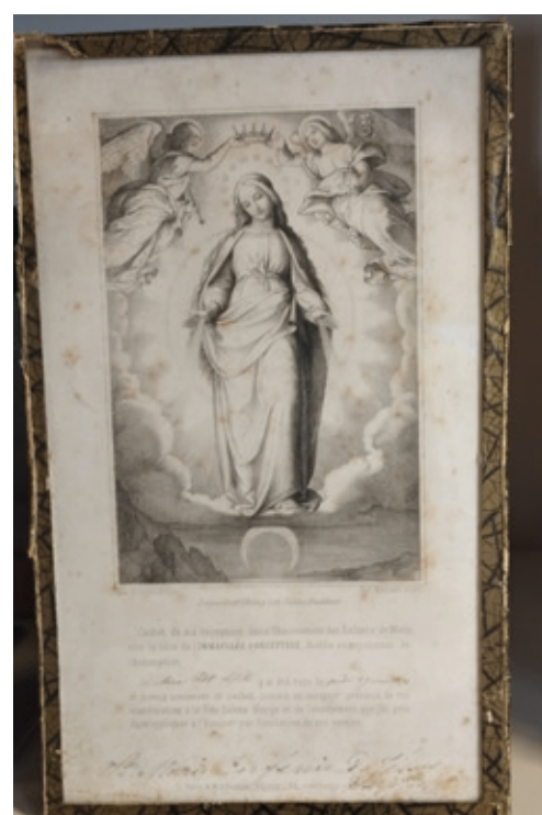
Compromiso de una estudiante como hija de María