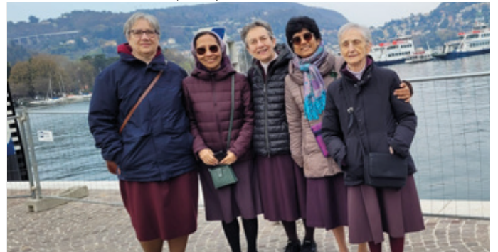
Visita a Italia - en Como (Italia)