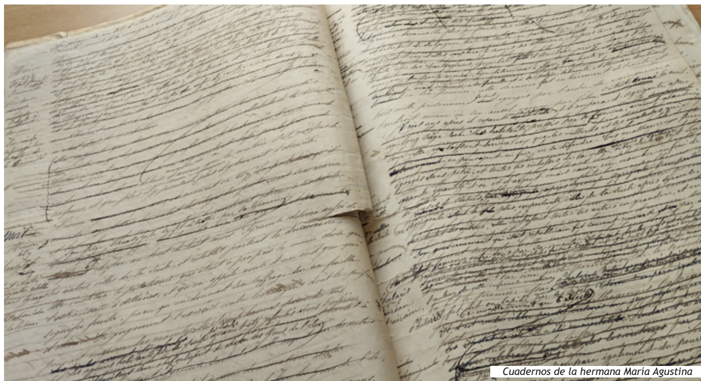
Cuadernos de la hermana María Agustina

atraer homenajes que rechazarían si supieran cuánto deshonran, y que otorgan a la posición y la fortuna de sus maridos un valor que raya con la bajeza; en fin, aunque piadosas, son muy ignorantes de la naturaleza de su religión, de todas sus verdades, de su historia, de lo que les haría comprender el espíritu social cristiano. Añado que pocas jóvenes han sido instruidas sobre la seriedad de la vida, sobre la importancia de los más mínimos pasos al principio, han sido fortalecidas contra sus reveses o sus dolores, y acostumbradas a ocuparse de las miserias que no ven, a ser indulgentes cuando se trata solo de su placer, a no ceder nunca cuando se trata de su deber».