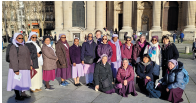
Peregrinación en el CGP