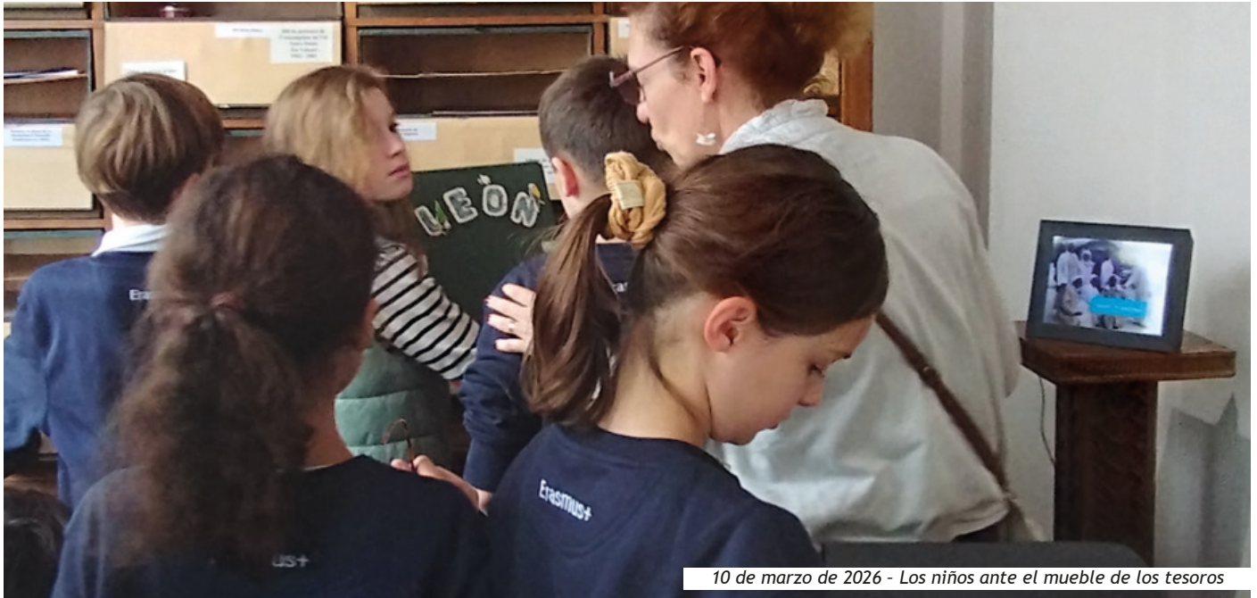
10 de marzo de 2026 - Los niños ante el mueble de los tesoros