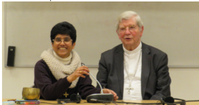
Rekha con el obispo Laurent Ulrich