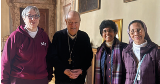
Visita a Europa - con el obispo de Como (Italia)