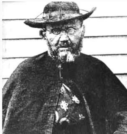
Le Père Damien en 1888

Pero su mayor sufrimiento a lo largo de esos años sería su soledad moral; los malos entendidos entre él y sus superiores, que no les gustaba la publicidad que se hacía de él, a pesar de él mismo, hizo que pasara varios años sin tener ningún hermano sacerdote, sin nadie con quien confesarse, puesto que se le había prohibido salir de la península desde que cayó enfermo. En esta situación, Damián rezaba; el Rosario va siempre con él, lo recita siempre que no está ocupado. La adoración también era, desde su noviciado, objeto de su devoción. También tenía amigos muy fieles, creyentes o