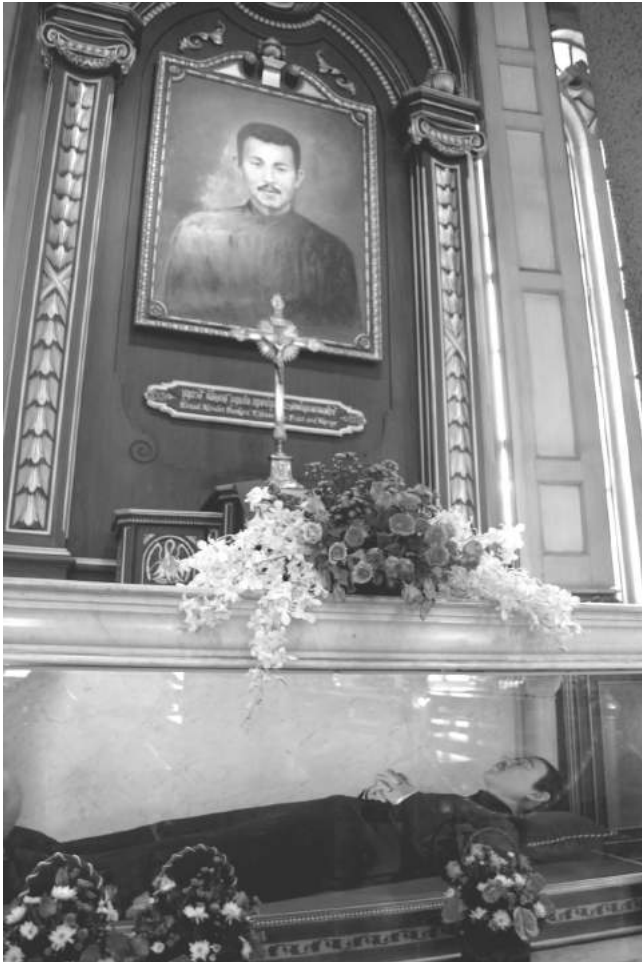
La tumba del Beato Nicolás en la Catedral de Ntra. Sra. de la Asunción, Bangkok