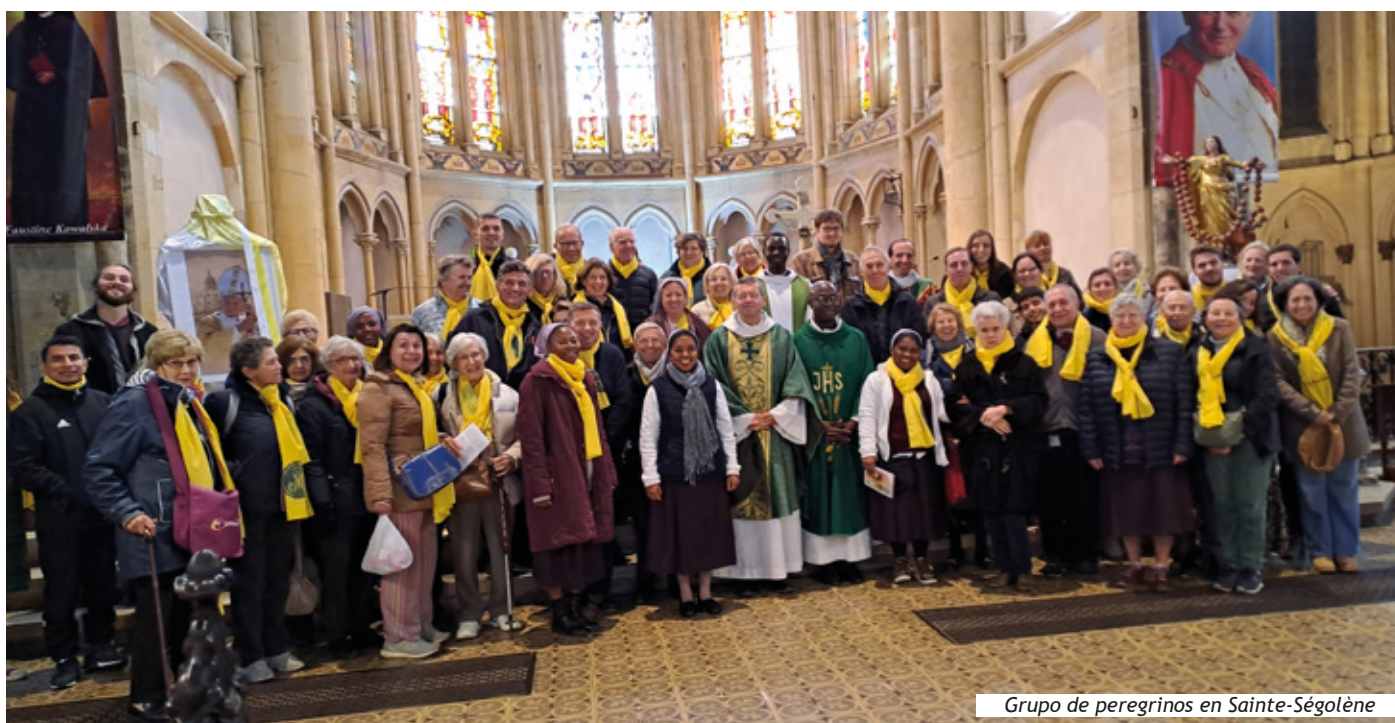
Grupo de peregrinos en Sainte-Ségolène

El original de esta estatua, la Consoladora de los Afligidos, se encuentra desde 1794 en la actual catedral de Notre Dame de Luxemburgo. Patrona de la ciudad de Luxemburgo y del Gran Ducado, su veneración se atestigua por primera vez en 1624. Ahora situada al fondo del coro de la catedral, se presenta a los peregrinos como una estatua vestida, de acuerdo con una tradición practicada en la cristiandad occidental desde finales de la Edad Media.