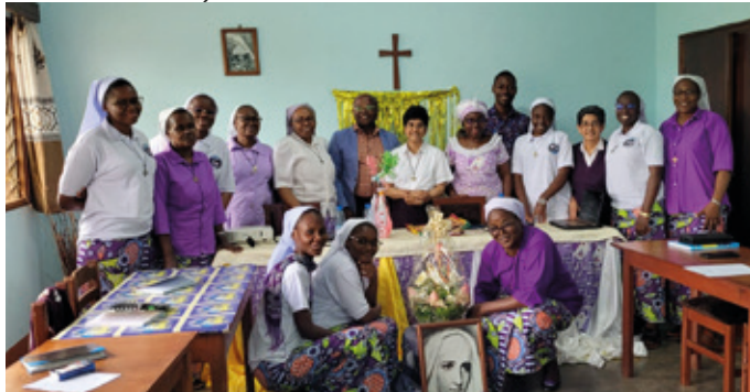
Visita canónica a África Central