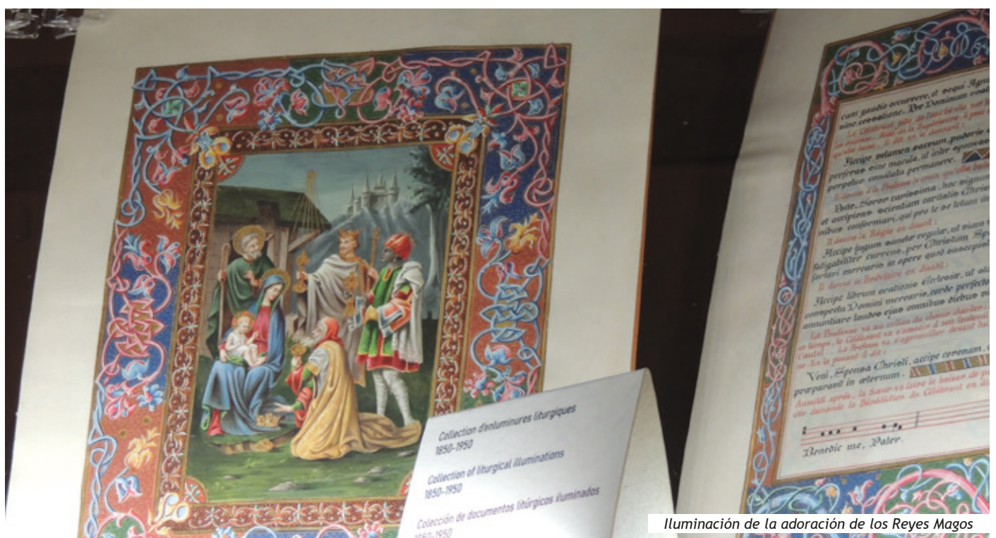
Iluminación de la adoración de los Reyes Magos