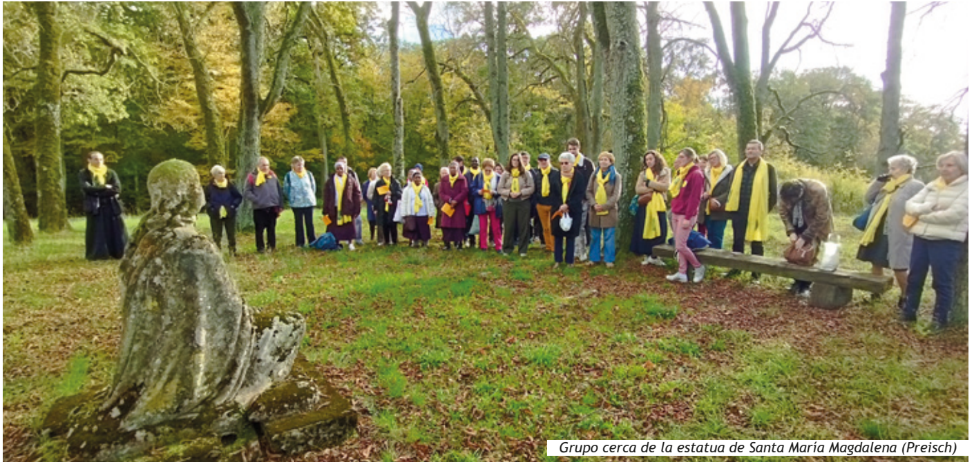
Grupo cerca de la estatua de Santa María Magdalena (Preisch)

Después de confiar la peregrinación a Nuestra Señora de la Consolación en la capilla de Auteuil y de recogerse en la capilla de Preisch, su antigua «morada», el grupo de peregrinos parroquiales tuvo la alegría de participar en el Marienlob, saludo a Nuestra Señora, Consoladora de los Afligidos, en la catedral de Luxemburgo: una larga oración compuesta por letanías cantadas a la Santísima Virgen y peticiones dirigidas a ella. Acompañados por la Virgen María, los peregrinos continuaron su camino hacia Metz, la casa natal, los apartamentos de la familia Milleret, la catedral y la iglesia de Sainte Ségolène, lugar de la primera comunión. Este es un ejemplo, entre muchos otros, de esa vuelta a los orígenes que viven cada año peregrinos procedentes de todos los países.