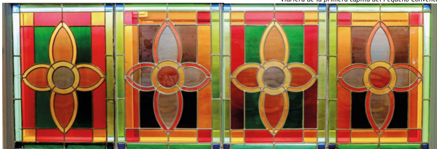
Vidriera de la primera capilla del Pequeño Convento