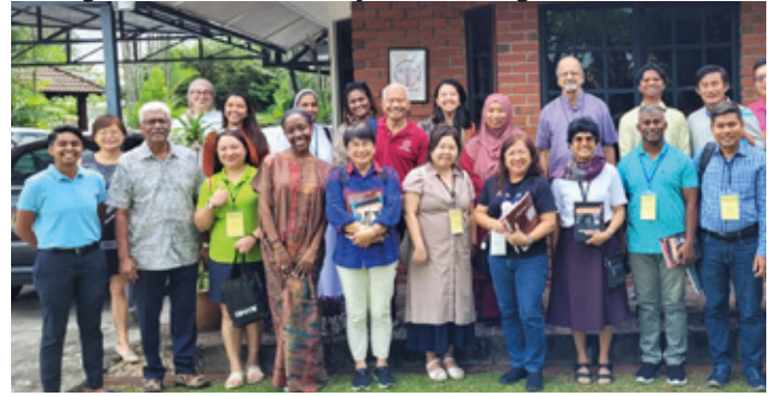
Los Migrantes en Asia: Retos y camino a seguir - Malasia 2025

participantes a «abrazar la formación como un camino sinodal para toda la vida». Hizo hincapié en que la formación no debe considerarse simplemente como una etapa preparatoria para el futuro ministerio, sino como un proceso continuo de conversión personal y comunitaria. Este camino sinodal, señaló, exige una escucha profunda al Espíritu Santo, a las Sagradas Escrituras, a la Iglesia, a los carismas de la propia congregación y a los gritos de un mundo herido.