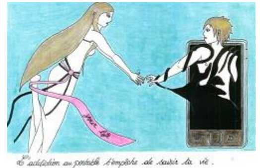
Ejemplo de cartel

Una de las últimas acciones llevadas a cabo fue la de la preparación y de la puesta en ejecución de un "día sin teléfono móvil". Se realizaron carteles de promoción de este día. La asociación SERA (Salud Entorno Ródano-Alpes) ayudó a los eco-delegados a realizar una encuesta en sus clases. Se han rodado algunos vídeos a partir de guiones inventados por los alumnos. Todos los alumnos pudieron aprovechar mini-conferencias y algunos fueron al Centro Documental para efectuar búsquedas sobre los daños de las ondas electro-magnéticas. Las radios locales y la prensa entrevistaron a algunos de los alumnos.