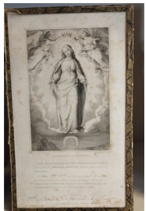
Engagement d'une élève comme enfant de Marie