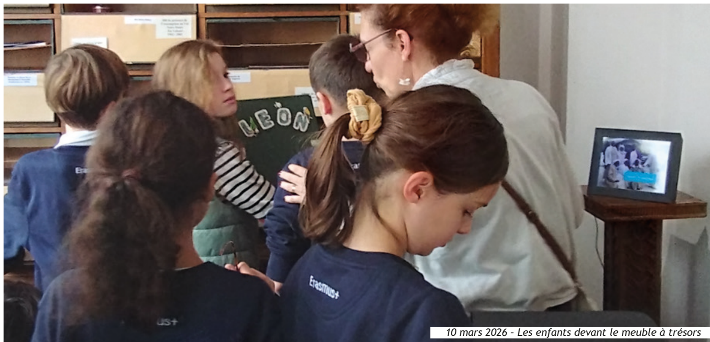
10 mars 2026 - Les enfants devant le meuble à trésors