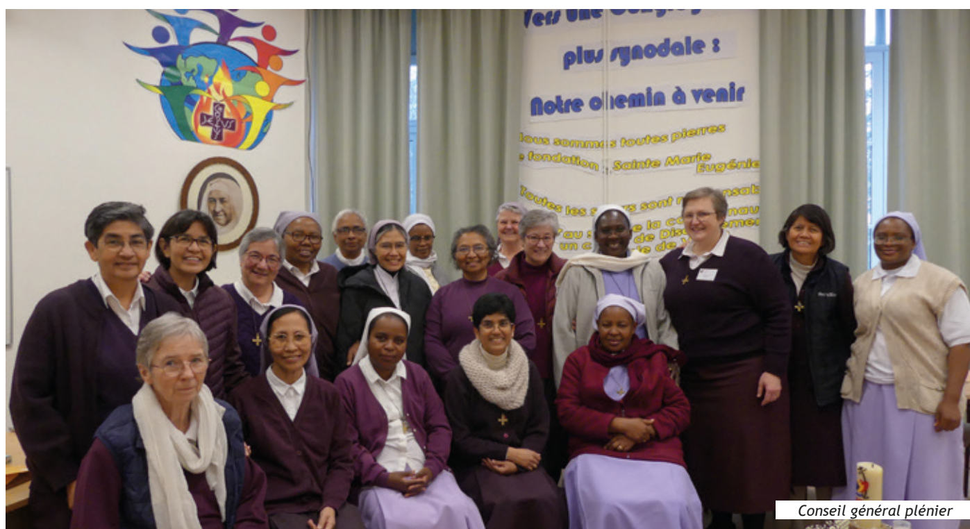
Conseil général plénier

Nous avons consacré un temps de qualité à l'écoute des expériences des provinces, en revisitant la mise en œuvre des appels et des invitations du Chapitre Général 2024. Même si nous ressentons le poids des difficultés propres à