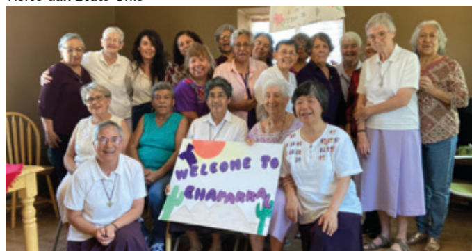
Communauté internationale des Canaries