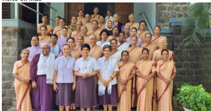
Visite canonique en Afrique centrale