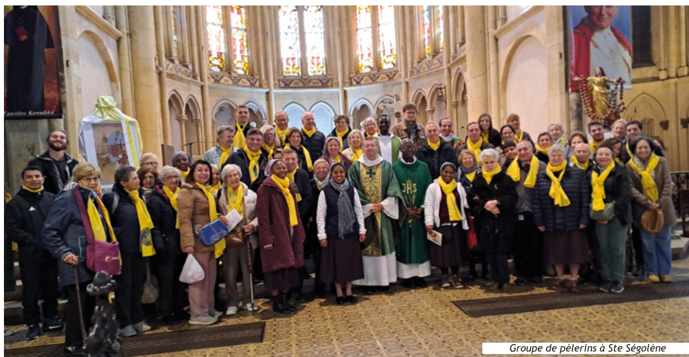
Groupe de pèlerins à Ste Ségolène

Après avoir confié le pèlerinage à Notre Dame de Consolation dans la chapelle