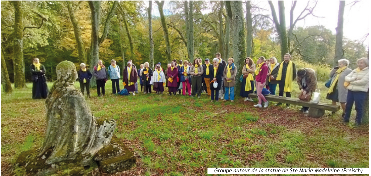
Groupe autour de la statue de Ste Marie Madeleine (Preisch)

d'Auteuil et s'être recueilli dans la chapelle de Preisch, son ancienne « demeure », le groupe du pèlerinage paroissial a eu la joie de participer au Marienlob, salut à Notre Dame, Consolatrice des Affligés, dans la cathédrale de Luxembourg : une longue prière composée des litanies de la Sainte Vierge chantées et de prières d'intercession dirigées vers elle. Accompagnés par la Vierge Marie, les pèlerins ont poursuivi leur route vers Metz, la maison natale, les appartements de la famille Milleret, la cathédrale et l'église Sainte Ségolène, lieu de la première communion. C'est un exemple, parmi tant d'autres, de ce retour aux sources que vivent, chaque année, des pèlerins venus de tous pays.