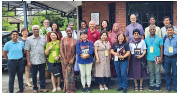
Les migrants en Asie : défis et voie à suivre - Malaisie 2025

Au total, 67 formateurs religieux – sœurs, prêtres et frères – provenant de neuf pays asiatiques (Bangladesh, Chine [Hong Kong et Macao], Inde, Indonésie, Malaisie, Myanmar, Philippines, Singapour et Vietnam) ont participé à l'atelier, représentant la riche diversité de l'Église asiatique.