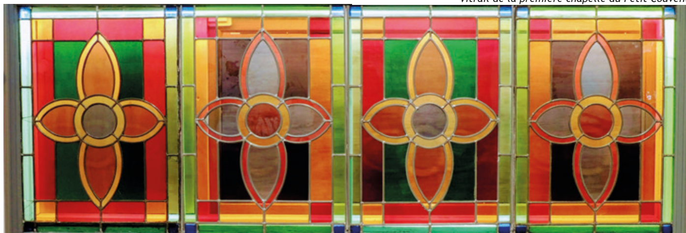
Vitrail de la première chapelle du Petit Couvent